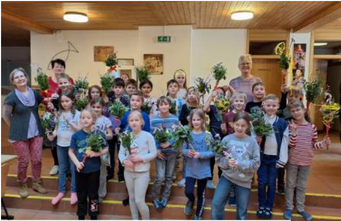
Palmbuschenbinden mit Erstkommunionkindern