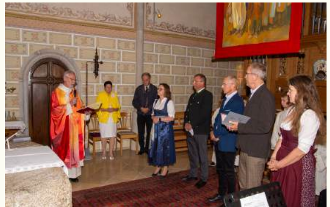
Verlesen des Dekrets und Beauftragung

■ Edeltraud Schubhart Fachteam Öffentlichkeitsarbeit