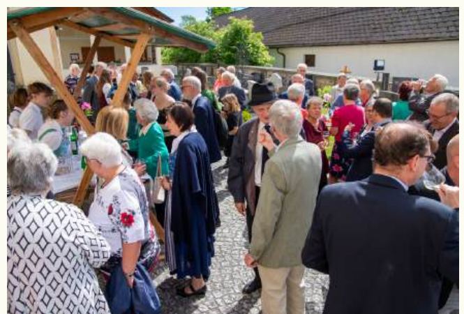
Agape vor der Pfarrkirche