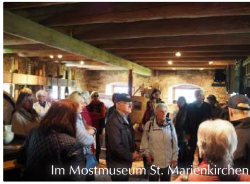
Im Mostmuseum St. Marienkirchen