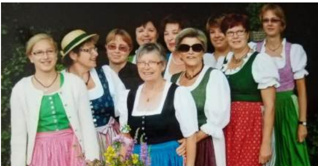
Gruppenfoto der Goldhaubenfrauen beim Kreuz (2012)

Auch wenn sich die Tradition rund um das Jubiläumskreuz im Laufe der Jahrzehnte stark verändert hat, bleibt dieser spirituelle Platz weiterhin ein Ort der Begegnung, der zum Innehalten und Kraft tanken einlädt.