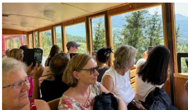
Mit der Zahnradbahn auf den Schafberg