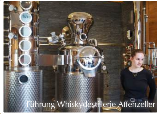
Führung Whiskydestillerie Affenzeller