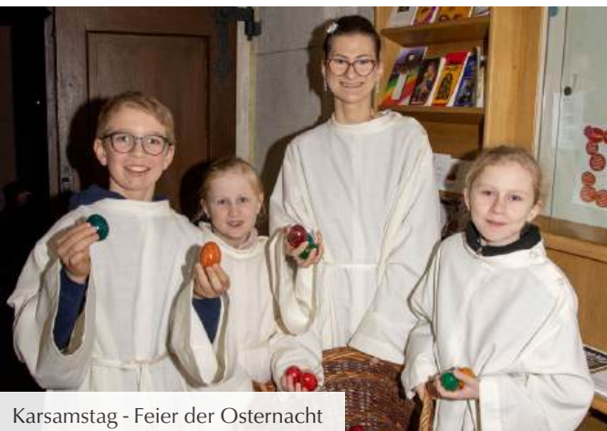
Karsamstag - Feier der Osternacht