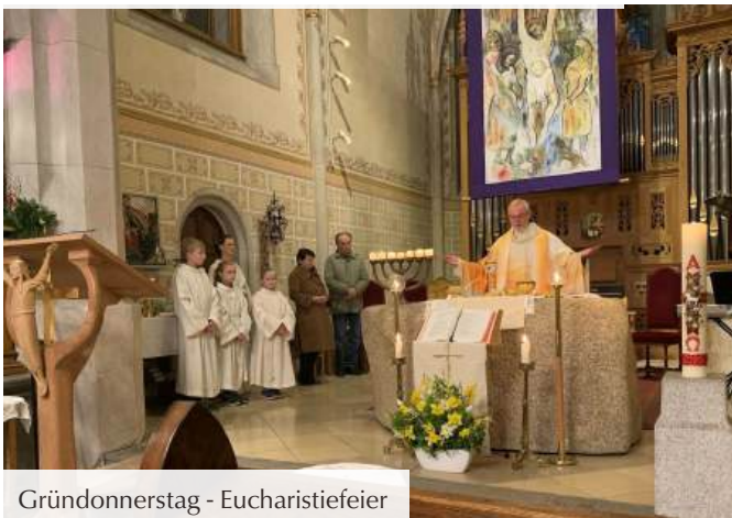
Gründonnerstag - Eucharistiefeier