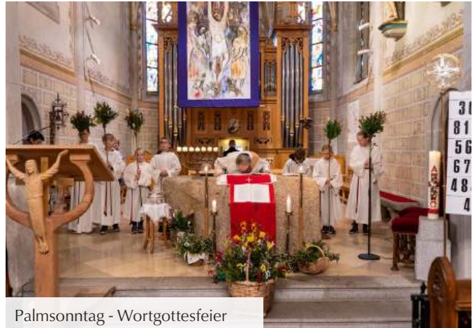
Palmsonntag - Wortgottesfeier