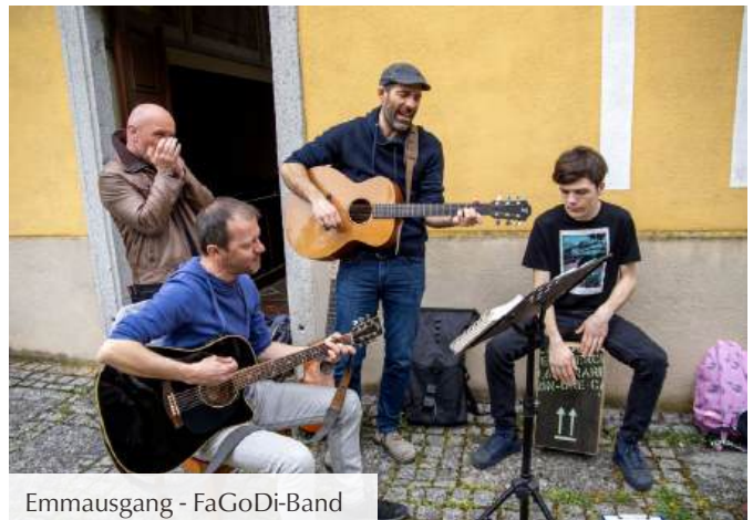
Emmausgang - FaGoDi-Band