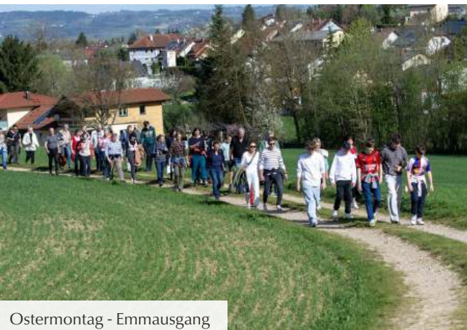
Ostermontag - Emmausgang