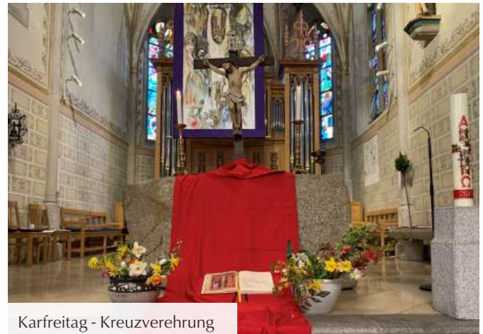
Karfreitag - Kreuzverehrung