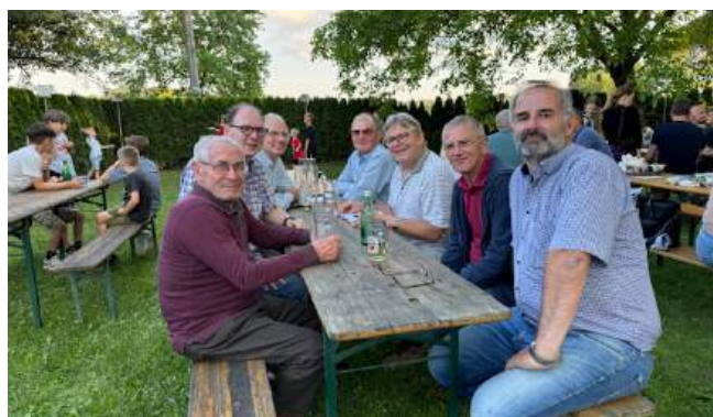
KMB-Sitzung beim Gasthaus Hollaus