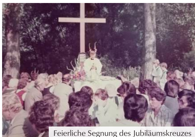
Feierliche Segnung des Jubiläumskreuzes